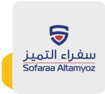
سفراء التميز Sofaraa Altamyoz

مكة المكرمة، بطحاء قريش Makkah, Batha Quraish