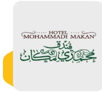
فندق محمد بن عبد الوهاب Mohammadi Makan Hotel

مكة المكرمة، طريق الملك عبدالعزيز Makkah, King Abdulaziz Road