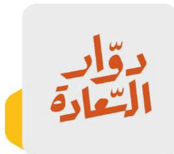
مطاعم ومعامل دوار السعادة Dawar Al-Sa'ada Restaurants