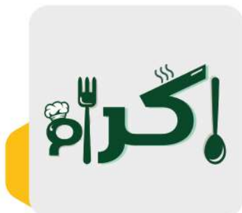
شركة إكرام لخدمات الإعاشة Ikram Catering Services Co.