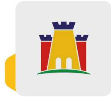
شركة قلعة المستهلك Qalaat Al-Mustahlek co.